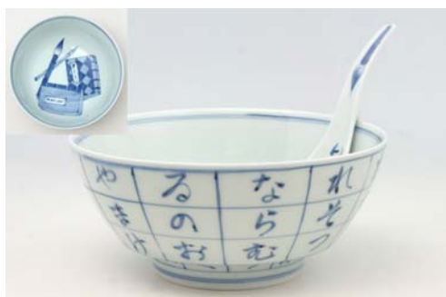
R0313 いろは・にほん ラーメン鉢 6,000 円 R2313 いろは・にほん レンゲ 溪山窯 2,000 円