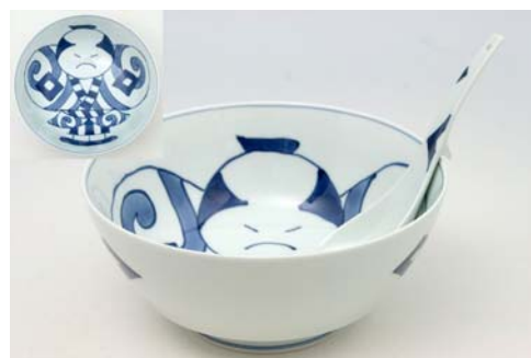
R0306 奴胤 ラーメン鉢 5,000 円 R2306 奴胤 レンゲ しん窯 1,800 円