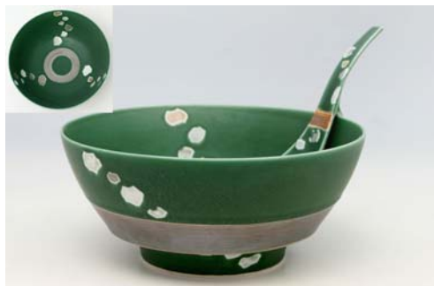
R0309 緑彩飛び石 ラーメン鉢 3,800 円 R2309 緑彩飛び石 レンゲ 伯父山 1,100 円