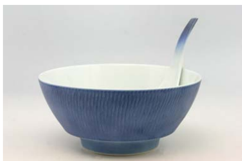
R0307 呉須吹飛び鉦 ラーメン鉢 4,000 円 R2307 呉須吹飛び鉦 レンゲ 李荘窯 1,800 円