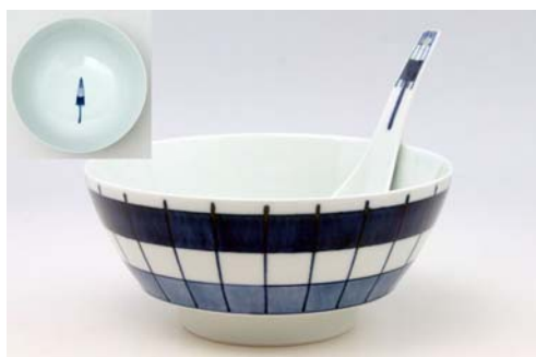
R0305 番傘 ラーメン鉢 7,000 円 R2305 番傘 レンゲ しん窯 1,800 円