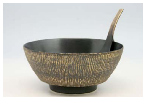
R0308 黒釉飛び鉦 ラーメン鉢 4,000 円 R2308 黒釉飛び鉦 レンゲ 李荘窯 1,800 円