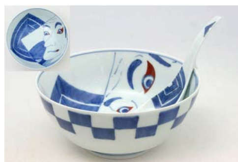
R0312 写楽 ラーメン鉢 8,000 円 R2312 写楽 レンゲ 溪山窯 2,000 円