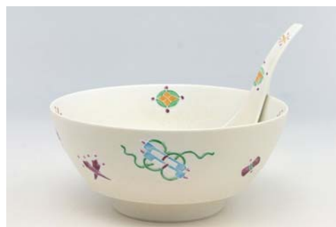
R0314 宝文 ラーメン鉢 8,600 円 R2314 宝文 レンゲ 錦右エ門陶苑 2,000 円