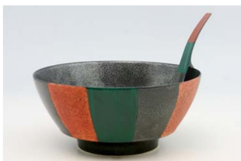
R0311 定式幕 ラーメン鉢 4,600 円 R2311 定式幕 レンゲ 原重製陶所 1,700 円