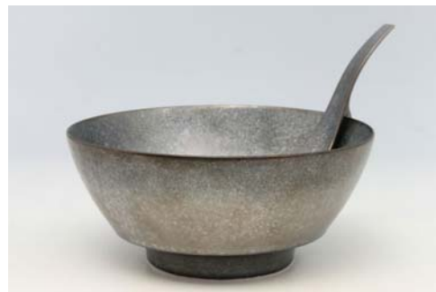
R0302 天岩戸・銀 ラーメン鉢 3,500 円 R2302 天岩戸・銀 レンゲ 陶悦窯 1,200 円