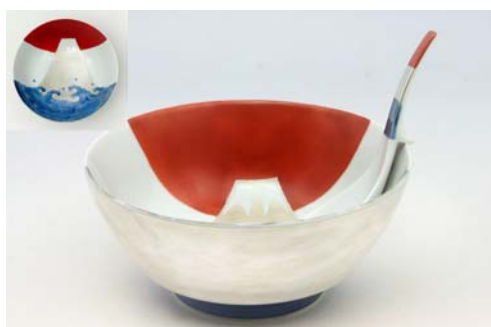
R0315 銀彩富士 ラーメン鉢 10,000 円 R2315 銀彩富士 レンゲ 福珠陶苑 2,000 円