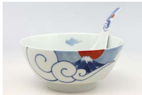
R0310 雲海富士 ラーメン鉢 5,000 円 R2310 雲海富士 レンゲ 伝平窯 1,300 円