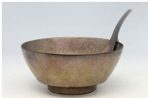
R0301 天岩戸・金 ラーメン鉢 3,500 円 R2301 天岩戸・金 レンゲ 陶悦窯 1,200 円