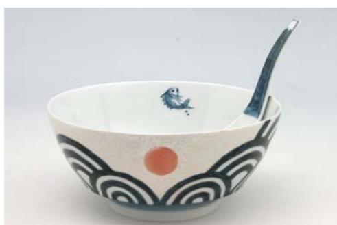
R0303 日出国 ラーメン鉢 4,300 円 R2303 日出国 レンゲ 田清窯 1,400 円