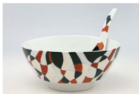
R0304 日本色彩 ラーメン鉢 5,800 円 R2304 日本色彩 レンゲ 田清窯 2,000 円